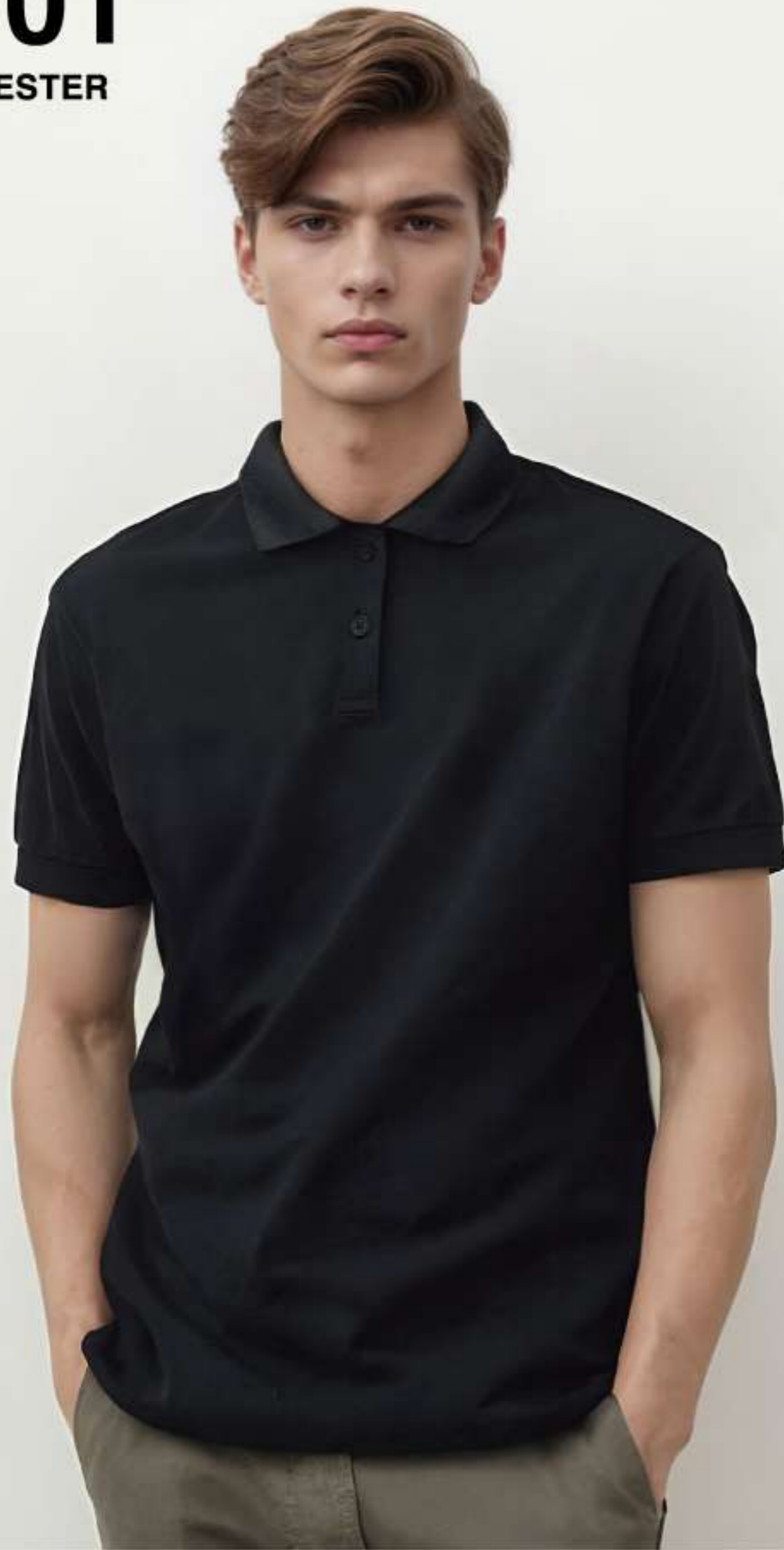
007 ブラック 身長180cm/Lサイズ着用