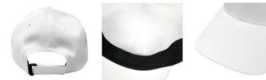
ホック式アジャスター

環境に配慮した「リサイクルポリエステル」生地を採用。 縫製ステッチが目立たないようにシームテープを貼付けてスッキリとした仕上がり。