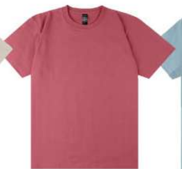
211 フラミンゴピンク