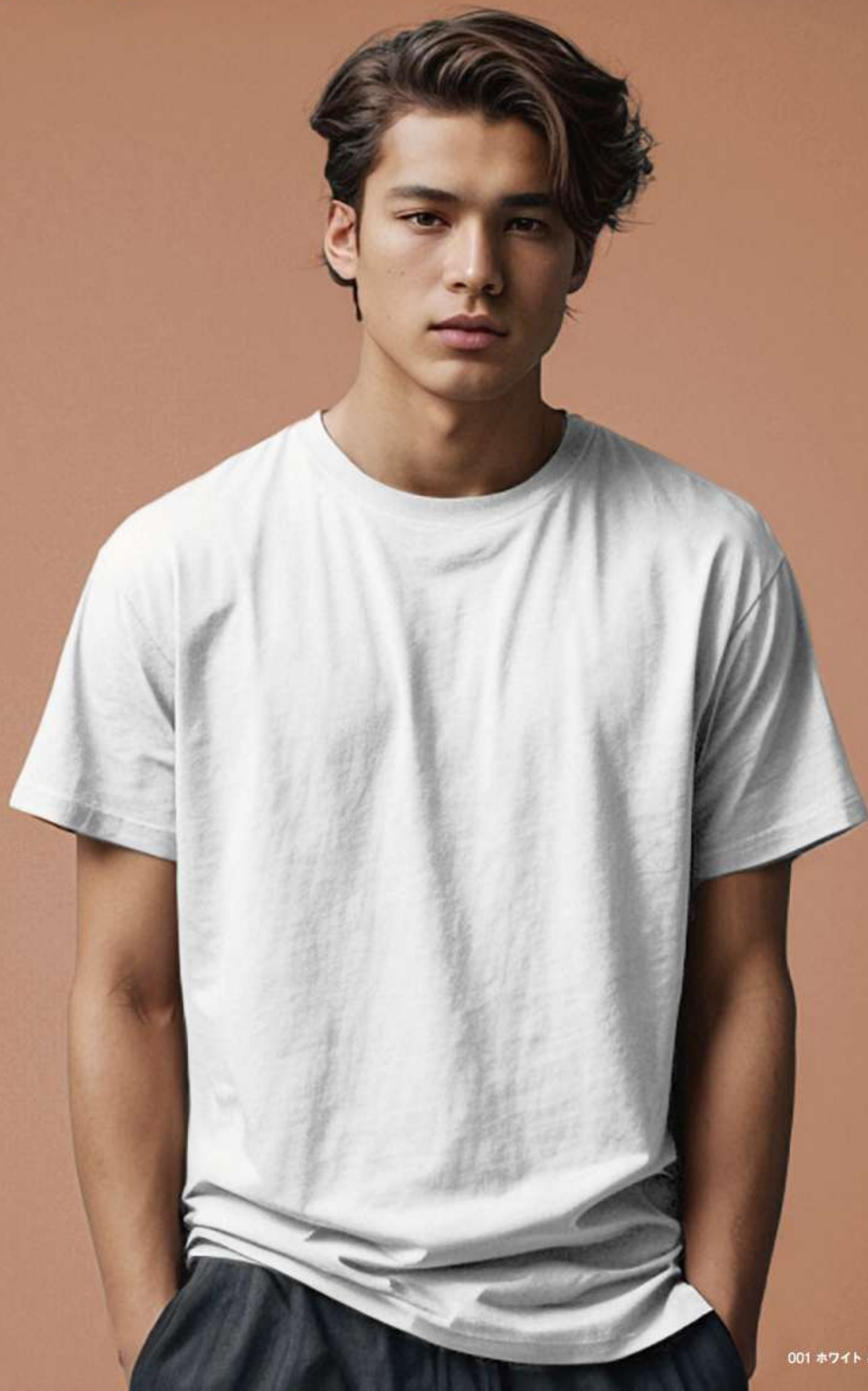
001 ホワイト 身長179cm/Lサイズ着用